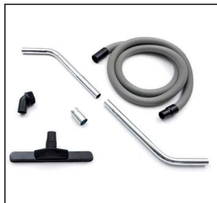
Zubehörkit „Standard“ für IDV 13