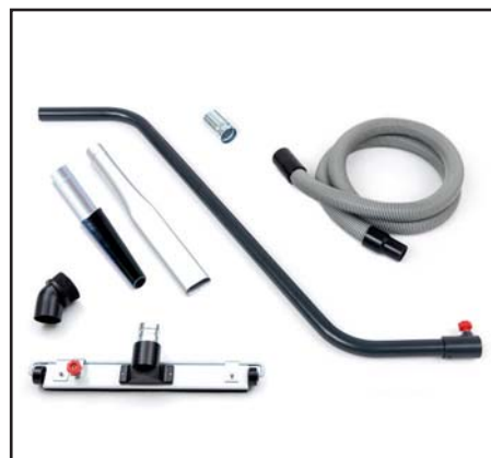
Zubehörkit „Professional“ für IDV 13